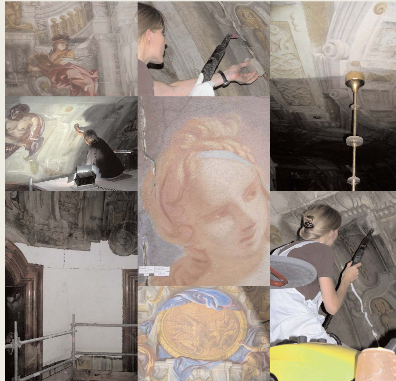
2004: Arbeiten am Deckenfresko des Marmorsaals

The hall was badly damaged in the Second World War and the roof was torn open, damaging the fresco. When the hall and fresco were restored after the war the original marble floor was also reconstructed.