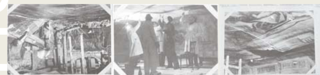
Restaurierungsarbeiten 1948 | Restoration treatment in 1948

Der Saal wurde während des zweiten Weltkrieges schwer beschädigt, das Dach des Marmorsaales aufgerissen und das Fresko beschädigt. Bei der nach dem Krieg folgenden Restaurierung v.a. des Freskos wurde der ursprünglichen Zustand des Marmorbodens wieder hergestellt.